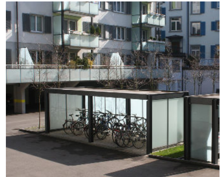
z.B. transluzentes Glas