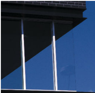
Transparente Ecken (Balkonverglasungen, Wintergärten, Eckfenster, etc.)