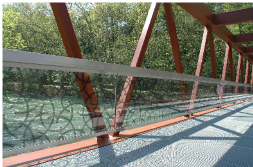
z.B. Muster aus Kreissegmenten