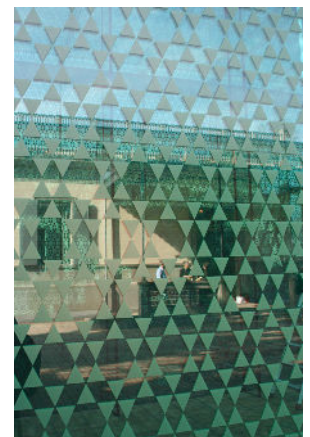
z.B. bedrucktes Glas