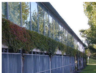
Grosse spiegelnde Glasflächen (linkes Bild) oder spiegelnde Metallfassaden (rechtes Bild)