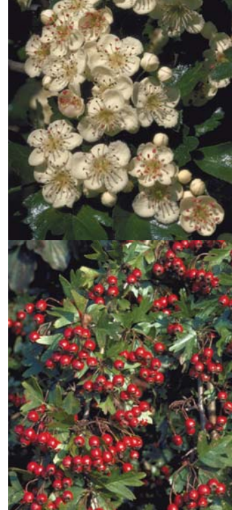
Weissdorn, oben die Blüten unten die Beeren

Beim Planen einer Hecke ist es wichtig auch an die spätere Bewirtschaftung zu denken: Wie soll die Hecke angelegt werden, damit der Krautsaum gemäht werden kann, ohne die angrenzende Fläche zu beanspruchen?