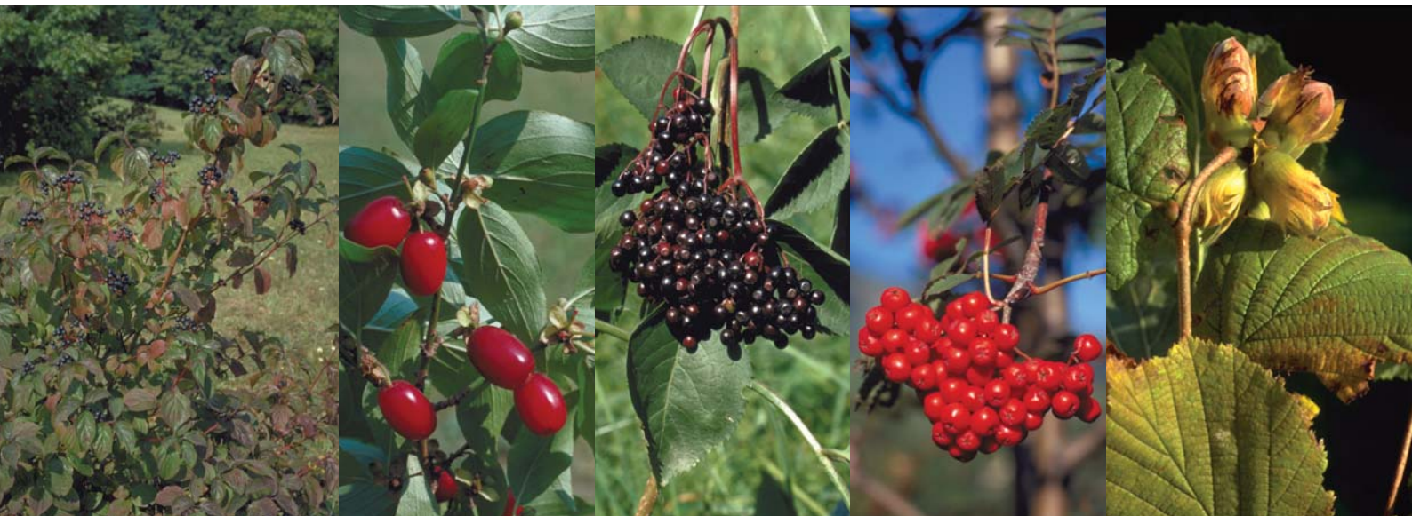
In einer artenreichen Hecke finden verschiedene Tierarten Nahrung wie Beeren, Nüsse usw. Hier eine kleine Auswahl von links nach rechts: Hartriegel, Kornellkirsche, Schwarzer Hollunder, Vogelbeerbaum, Haselnuss